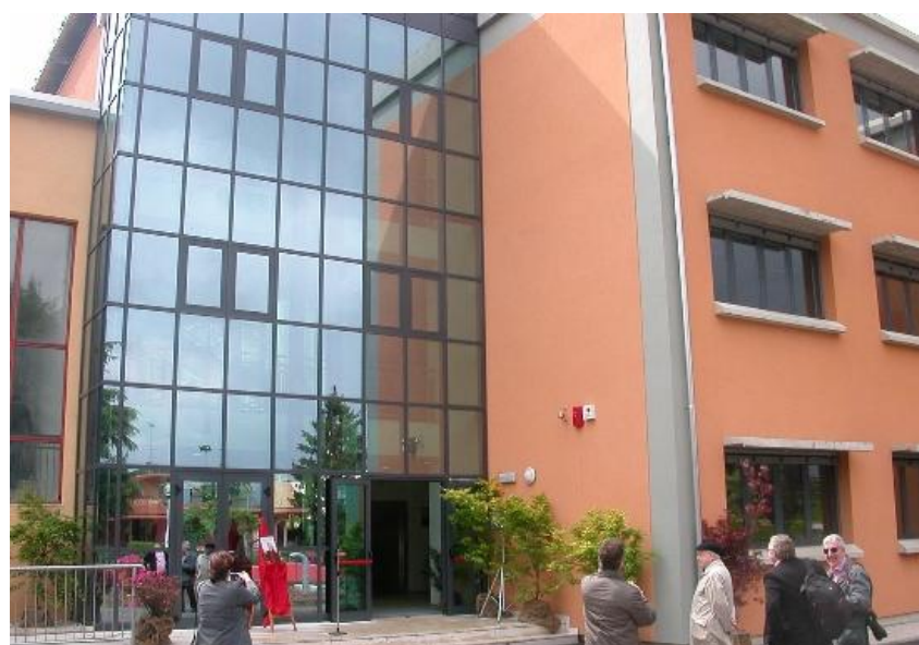
Sopra. la nuova sede di Via Veneto

Il convegno è risultato molto interessante, e finalmente è stato fatto conoscere Silvio Ceccato a noi studenti che non sapevamo chi fosse, agli insegnanti, ma soprattutto alla cittadinanza. I festeggiamenti sono poi proseguiti, l'8 maggio, con l'inaugurazione del nuovo istituto in Via