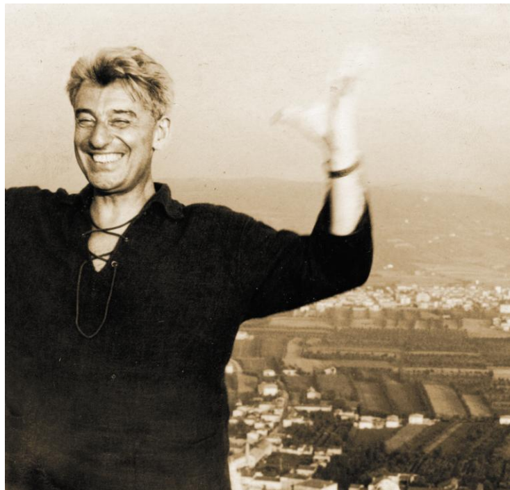
Sopra, Silvio Ceccato affacciato ai Castelli di Montecchio.

Questa è la frase che ci ha fatto conoscere Silvio Ceccato, un uomo, un artista, un filosofo, nato "per caso" a Montecchio Maggiore nel 1914, nella splendida Casa Rossa di famiglia, vissuto tra Montecchio e Milano; "re" della cibernetica, inventore nel 1956 di "Adamo II", la famosa macchina pensante; studioso di giurisprudenza, violoncello e composizione musicale. Scrittore di famosi libri tra i quali: "Un tecnico tra i filosofi", "Come filosofare (vol.1)" e "Come non filosofare (Vol.2)", "la linea e la striscia", "Ingegneria della felicità", "Il linguista inverosimile" e molti