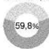
Ragazzi tra i 15 e i 25 anni che usano le chat