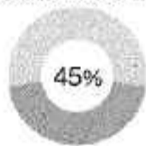
Ragazzi tra 11 e 17 anni che usano Internet